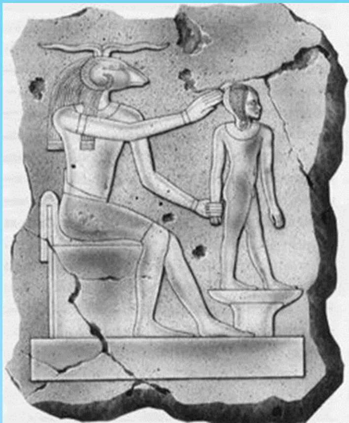
Египетский творец Хнум творит человека из глины