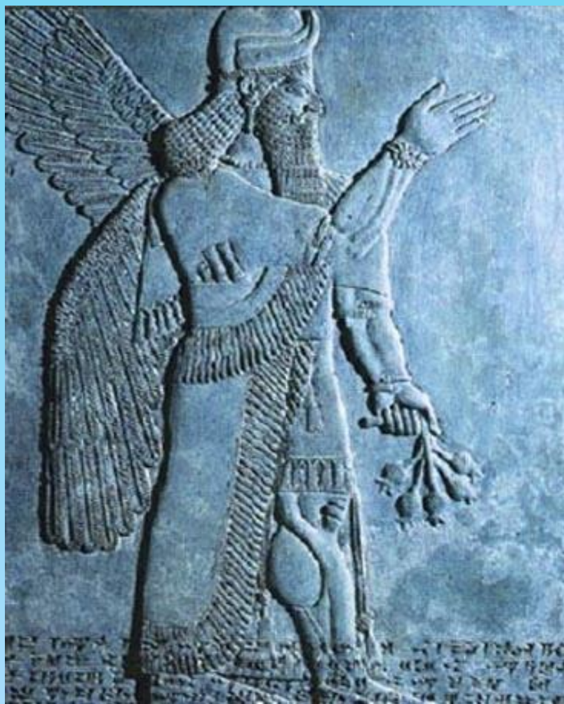
Шумерский бог Неба Ан

Небо для всех народов — универсальный образ верховного Бога. Неслучайно имена праиндоевроп. Дьяуса, Зевса, Юпитера или латинское слово " deus " ("бог") связаны с корнем deiwo со значением " ясное Небо ".